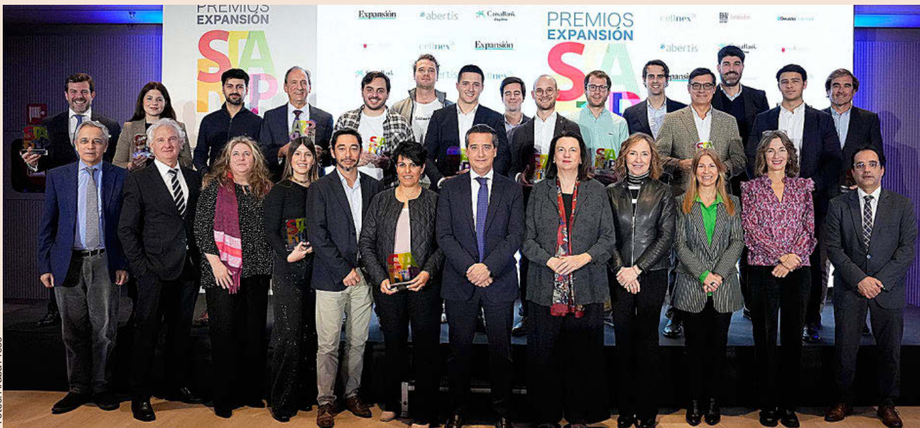
Foto de familia de premiados, patrocinadores y colaboradores de la quinta edición de los Premios EXPANSIÓN Start Up, el pasado miércoles.