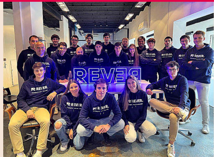
Equipo de Rever.

Mundi Ventures, Barlon Capital y Sequoia, además de otros inversores nacionales e internacionales como Wayra, el hub de innovación de Telefónica. “Nuestra propuesta se basa en una solución B2B SaaS súper escalable que permite solicitar una devolución en tan solo dos clics y obtener el reembolso en 24 horas”, explican desde la start up .