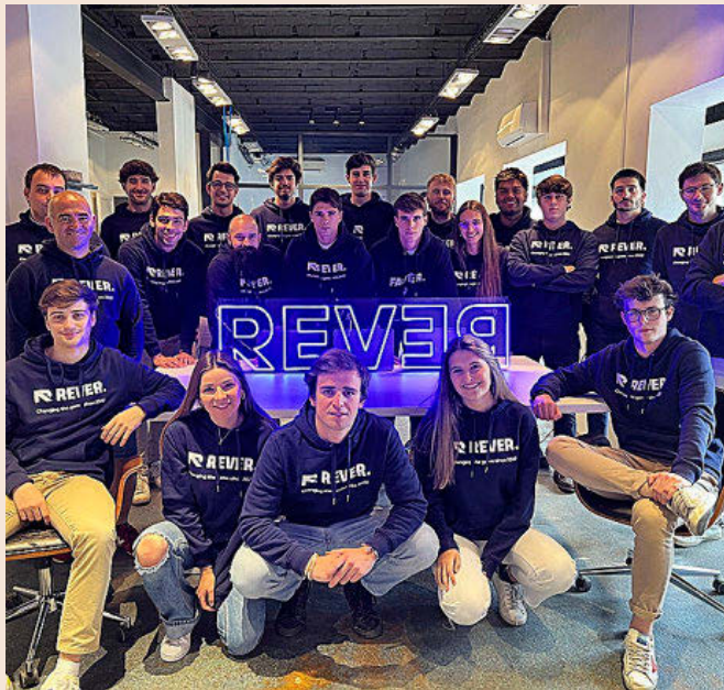
Equipo de Rever.