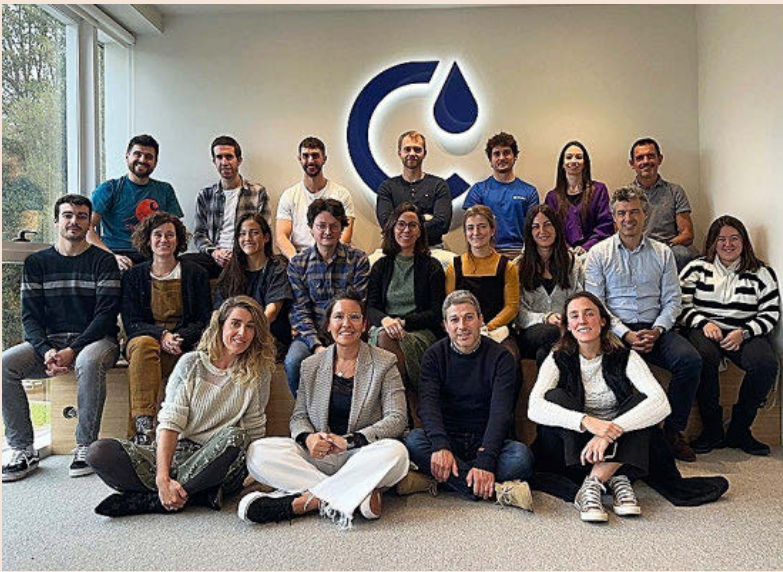
Equipo de Cimico.