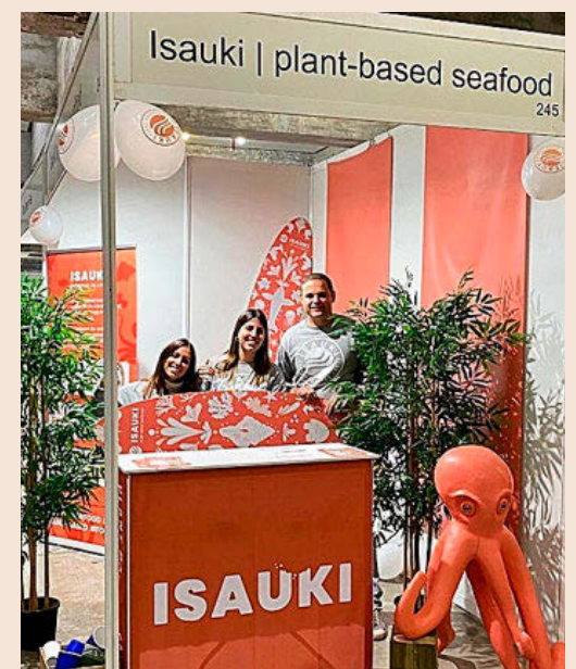
Equipo de Isauki, firma fundada por Milos Dukat.

las anillas de calamar plant based , enfocados a los consumidores veganos, al público flexitariano con interés en incorporar nuevas opciones vegetales a su dieta y a aquellas personas que tienen alergias e intolerancias", explican en Isauki. Uno de sus valores diferenciales es la apuesta por la investigación continua para el desarrollo de nuevas texturas y sabores. Según cifras de Isauki, la elaboración de sus productos a partir de algas marinas permite la reducción de entre un 30% y un 50% de la destrucción del fondo marino por una pesca excesiva.