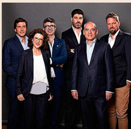
Equipo fundador de Build to Zero.

calor industrial electrificando con energía renovables, mediante una solución que combina el power to heat con el almacenamiento térmico; proporcionar servicios de flexibilidad a la red eléctrica; y eliminar el vertido de generación renovable, ampliando el tamaño de las instalaciones de autoconsumo. Cerró 2022 con una facturación de 60.000 euros. La previsión para 2023 es de 850.000 euros.