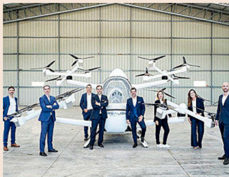
Miembros del comité ejecutivo de Crisalion Mobility con uno de los vehículos aéreos de la empresa.

Crisalion Mobility , la antigua Umiles Next, apuesta fuerte por la movilidad aérea y terrestre. Sus promotores están convencidos de que en 2030 las aeronaves eléctricas estarán presentes de forma habitual en trayectos urbanos y regionales y recuerdan que ya existen experiencias de movilidad terrestre autónoma teledirigidas desde un centro de control como la que ellos han desarrollado. La empresa ha llevado a cabo pruebas de vuelo en